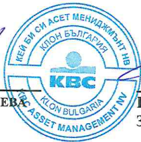
ПАТРИК ВАН ЛОИ ЗАМ. УПРАВИТЕЛ